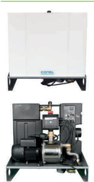
Abb. Modell ohne Füllstandsanzeige

Kompakter, anschlussfertiger Regen-Meister zur Steuerung der Wasserversorgung mit Regenwasser. Ideal für die Wasserversorgung für Toilettenspülungen, Waschmaschinen oder Gartenbewässerung.